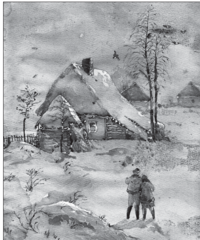
Romantickou krajinu Haliče - únor 1915 věnuje pan J. C. z ulice Kralické. Děkujeme

Děkuji za rozhovor a osobně Vám přejí pevné zdraví a dlouhý starostování. Gabriela Zeisberger