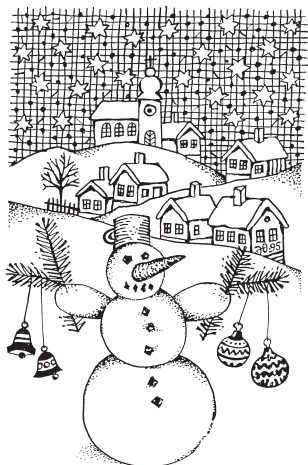
Kresba: Jindřich Oleš

Leden v pranostikách hovoří zejména o úrodě,